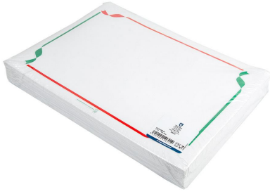
Imagen de paquete