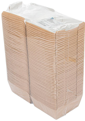
Imagen de paquete