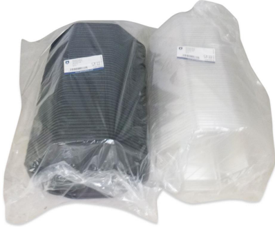
Imagen de paquete

Reglamento (CE) nº 2023/2006 de la Comisión Europea de 22 de diciembre de 2006, sobre buenas prácticas de fabricación de materiales y objetos destinados a entrar en contacto con alimentos.