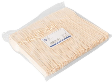
Imagen de paquete

Reglamento (CE) nº 2023/2006 de la Comisión Europea de 22 de diciembre de 2006, sobre buenas prácticas de fabricación de materiales y objetos destinados a entrar en contacto con alimentos.