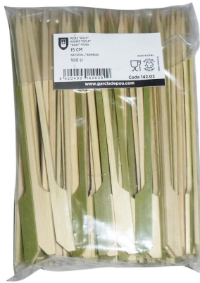
Imagen de paquete